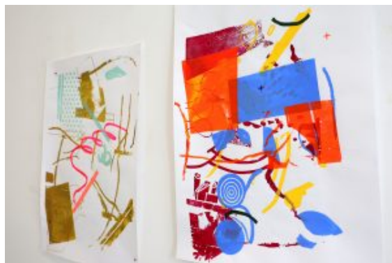
Composição Roubo – direitos reservados

Duarte, do atelier DDLX, curador das mostras.