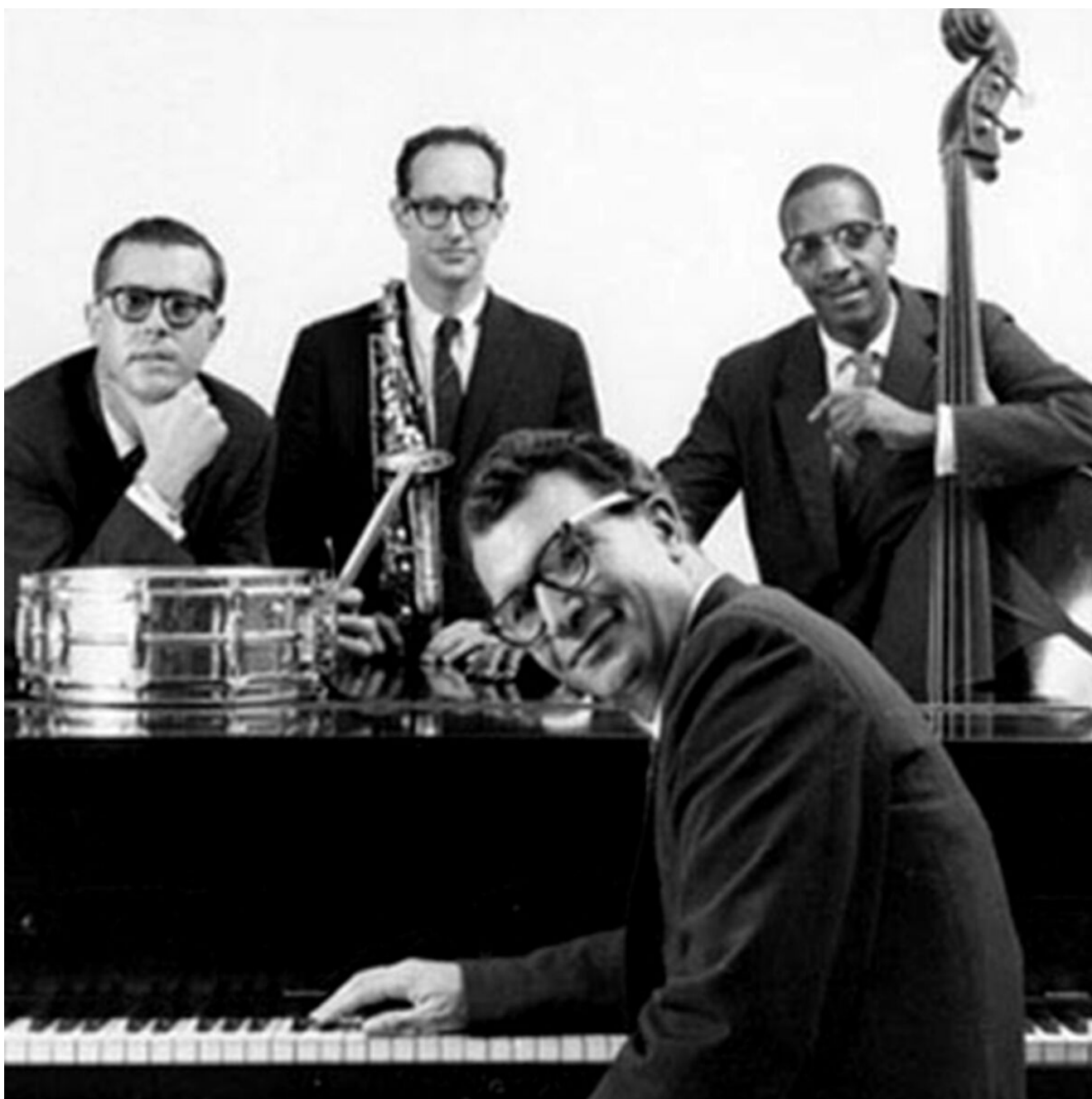
Quarteto de Dave Brubeck.

Aos arranjos mais elaborados, juntava-se uma nova utilização de diferentes compassos, desde o 3/4 ao 5/4 que Dave Brubeck adaptou para o seu tema mais conhecido, "Take Five" .