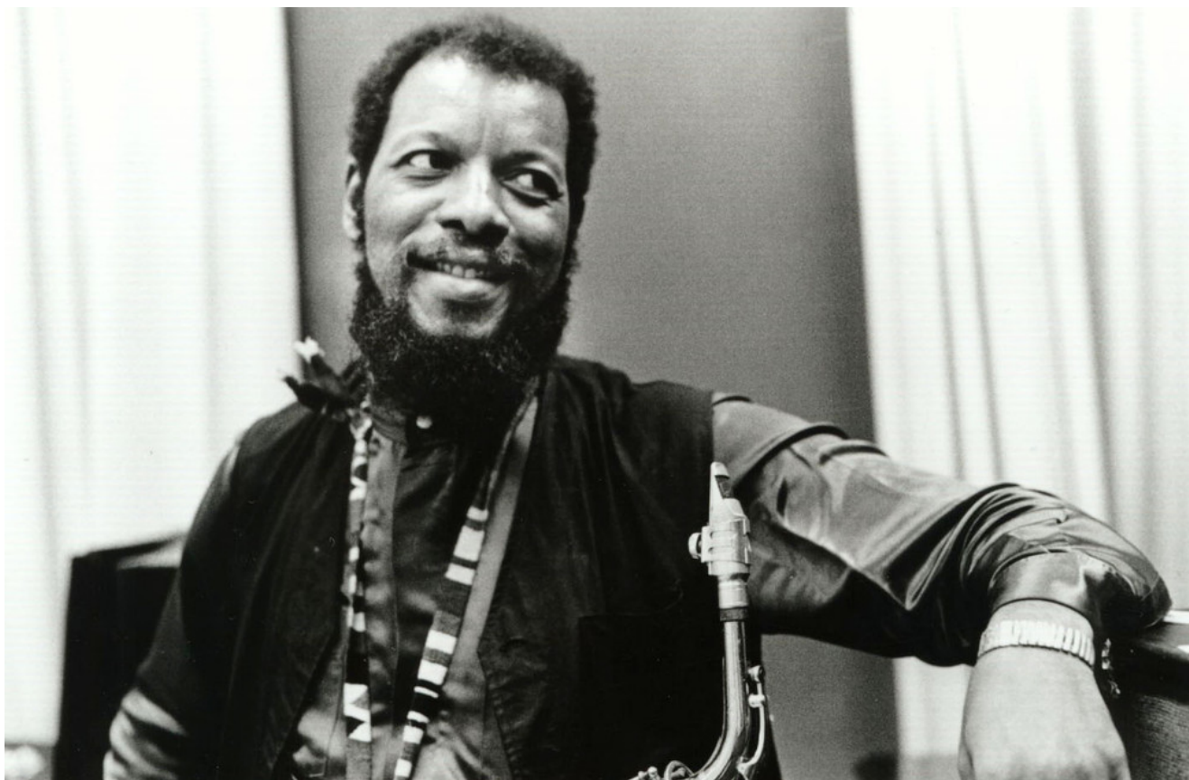
Ornette Coleman.

Os impressionistas franceses, Stravinsky e Dave Brubeck, foram os alicerces da escola do pianista Cecil Taylor. As suas actuações ao lado de Steve Lacy no Five Spot, nos finais dos anos 50, e o seu contacto com escritores, artistas e performers, no clube de Nova York, enraizaram a sua técnica mais percutida e a sua busca de novas e vibrantes sonoridades.