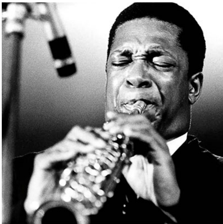
John Coltrane.

O grupo de negros que não pactuava com este estilo adocicado de tocar jazz, colocaram Art Blackey à cabeça, numa forma mais dura de tocar jazz, como indica bem o nome do grupo de Blackey, " Jazz Messengers ". Charles Mingus veio juntar-se a esta nova forma de sonoridade negra, o Hard Bop .