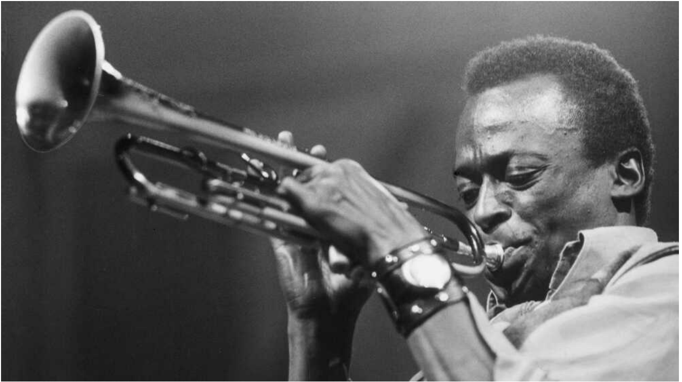
Miles Davis.

A reacção foi dada, passada uma década, por Ornete Coleman com o Free dos anos 60 e aí o jazz voltou a estar na linha da frente, estética, política e culturalmente.