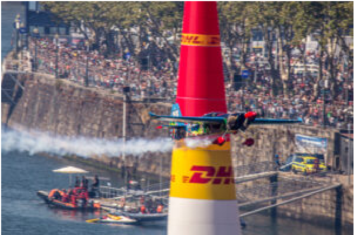
Red Bull Air Race (arquivo 2017).