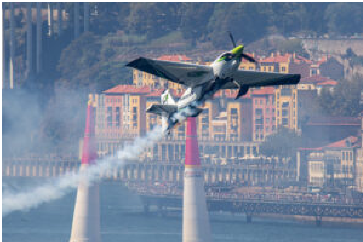
Red Bull Air Race (arquivo 2017).