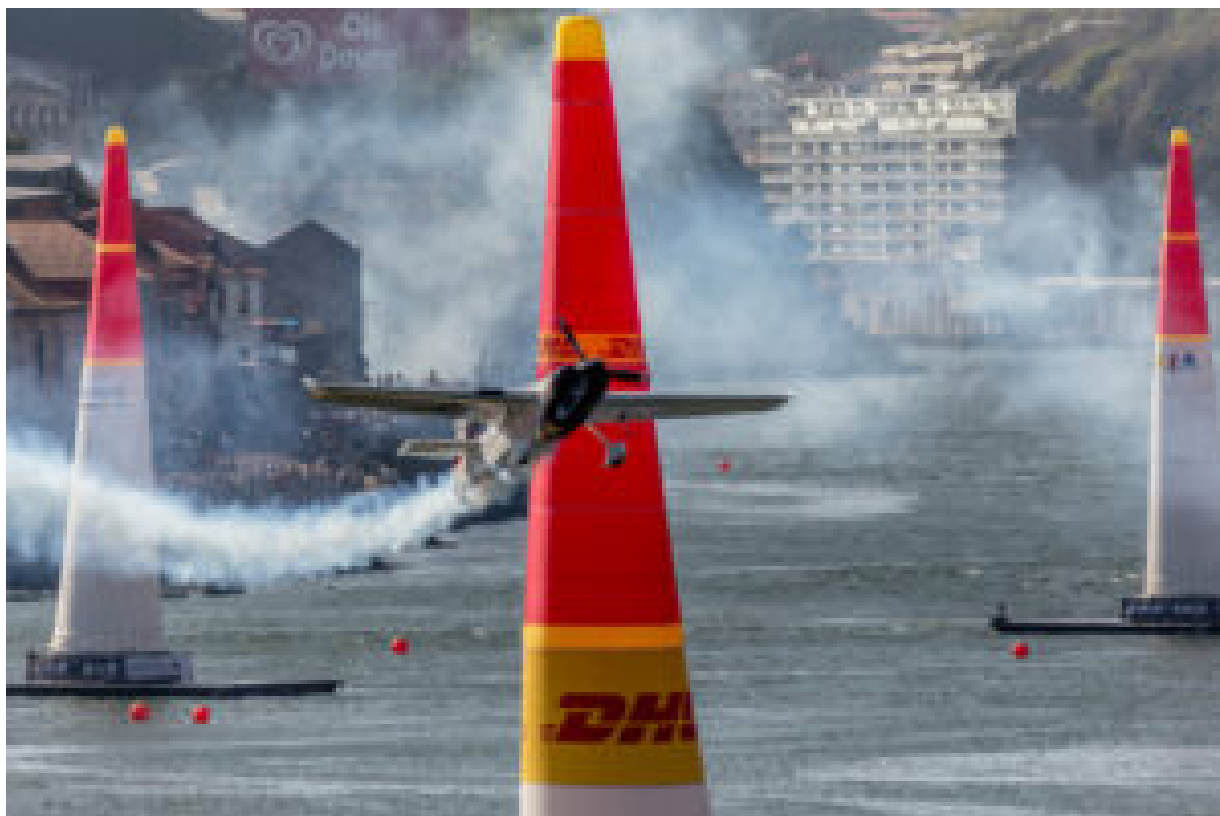
Red Bull Air Race (arquivo 2017).

Com uma programação diversificada e de entrada livre , o evento promete transformar as margens do Douro num palco de emoções, inovação e sustentabilidade, consolidando-se como uma referência no calendário internacional de eventos aeroespaciais.