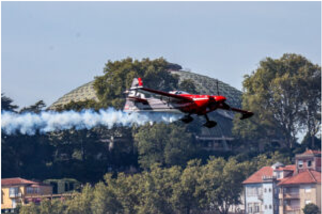
Red Bull Air Race (arquivo 2017).