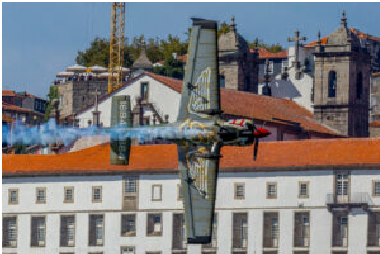
Red Bull Air Race (arquivo 2017).