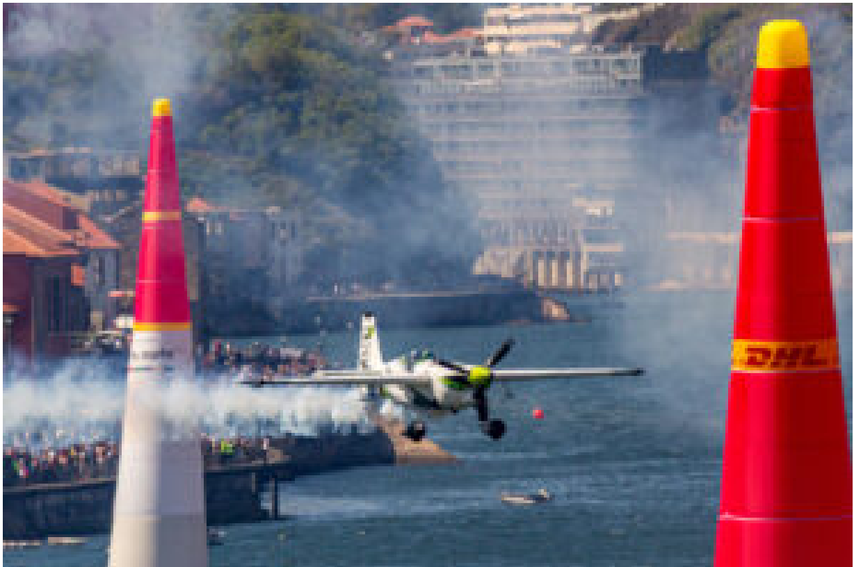
Red Bull Air Race (arquivo 2017).