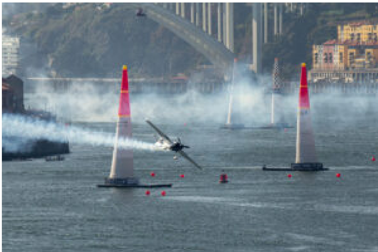
Red Bull Air Race (arquivo 2017).

Sobre a despesa com a organização do evento, o governante revelou que “no caso do Estado são pouco menos de quatro milhões de euros e que, com as câmaras municipais, chegará aos cinco milhões e pouco” .