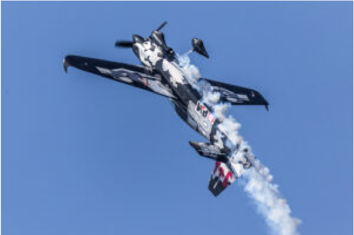
Red Bull Air Race (arquivo 2017).

Incluído no evento estará uma exposição de 40 aviões, alguns que estiveram na II Guerra Mundial, no aeródromo da Maia, bem como a tentativa de bater o recorde europeu drones no ar, revelou Luís Castro.