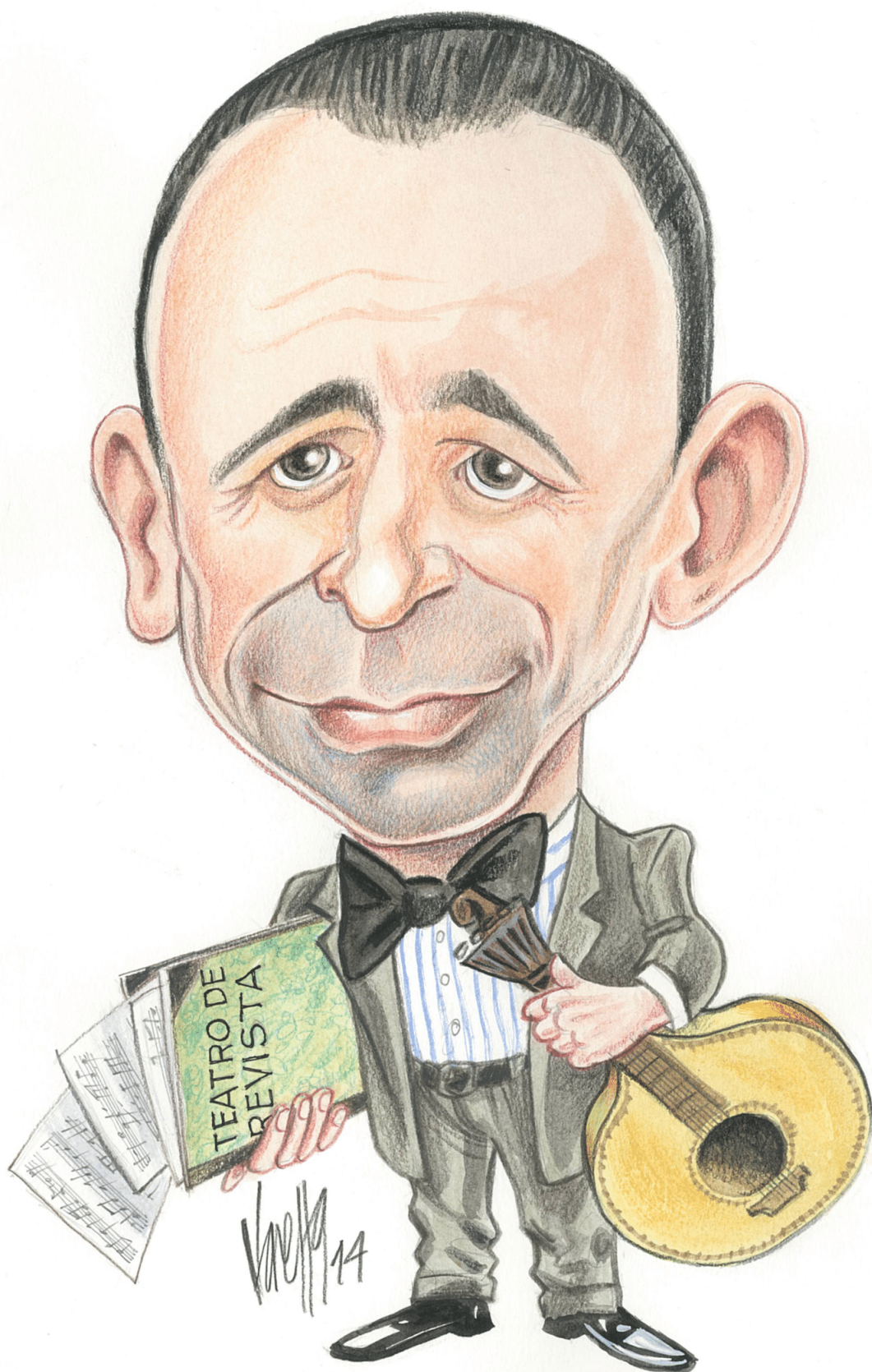
Caricatura de Avelino Carneiro, por Onofre Varela. Aguarela e lápis de cor. 2014