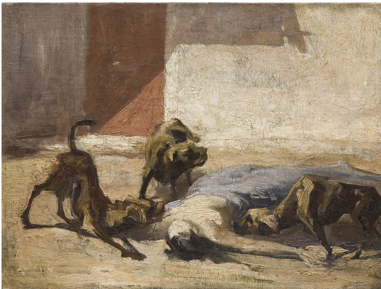
Jezebel Devorada por Cães.

Entre os temas mais frequentes da sua obra encontram-se os retratos e os autorretratos. Estes trabalhos constituem verdadeiros estudos psicológicos. Frequentemente marcados pela intensidade do olhar, parecem estabelecer uma comunicação direta com o observador , transmitindo emoções que oscilam entre a serenidade, a melancolia e a introspeção.