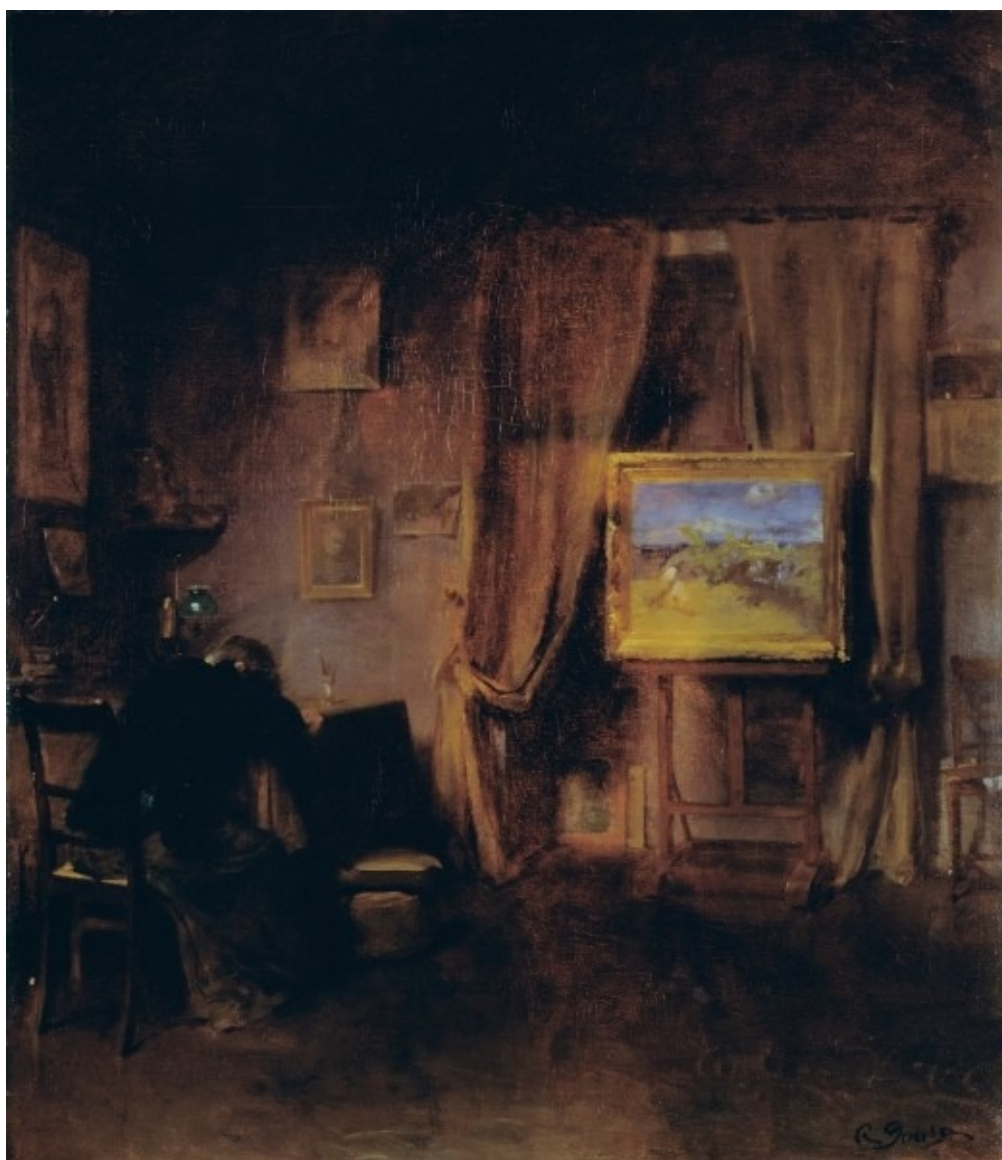
No Atelier. Direitos Reservados

Impedida de viajar devido ao eclodir da Primeira Guerra Mundial, Aurélia expôs pela primeira vez na Sociedade Nacional de Belas-Artes, em Lisboa, em 1916 . Aí chamou a atenção de Columbano Bordalo Pinheiro, então diretor do Museu de Arte Contemporânea, que adquiriu uma das suas obras para a coleção do museu.