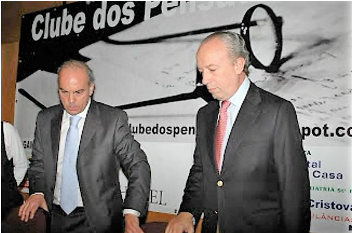
Com Pedro Santana Lopes.

Se não fosse a lei da limitação de mandatos, ainda hoje Alberto João Jardim seria presidente regional da Madeira O Alberto João Jardim foi o melhor governante da Madeira em todos os aspectos.”