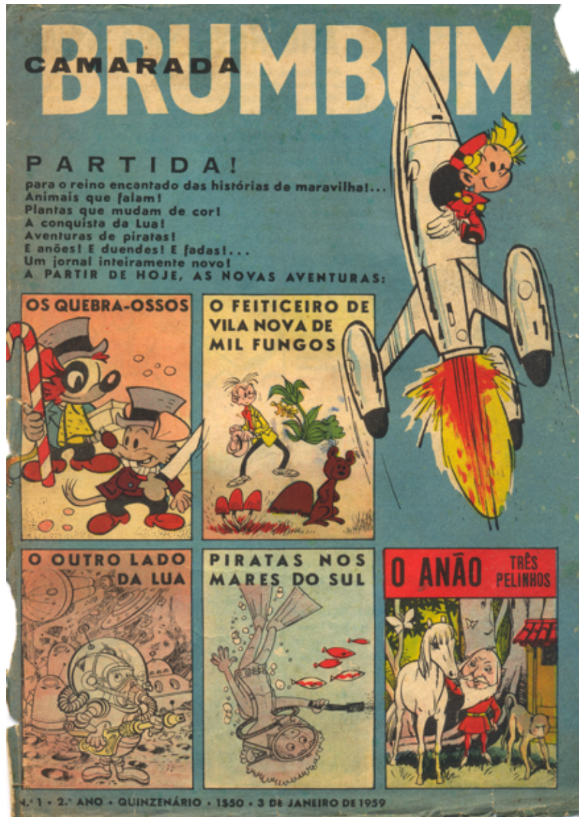
Capa da revista "Camarada" Nº1, 2º Ano. Janeiro de 1959.