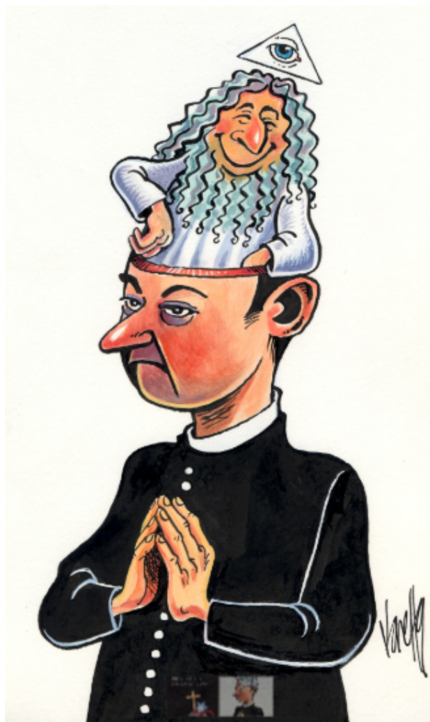
Ilustração do frontispício do livro.