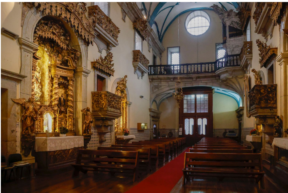
Interior da Igreja de Massarelos.

No interior da Igreja de Massarelos, uma igreja barroca de nave única e capela-mor retangulares, percebemos rapidamente, como nos explicou José Santos que “esta igreja não teve sempre esta configuração. A pequena capela que os marinheiros erigiram sobre aquilo que era chamado o Penedo da Paixão, conforme está descrito nos livros, correspondia sensivelmente à atual zona do altar-mor.”