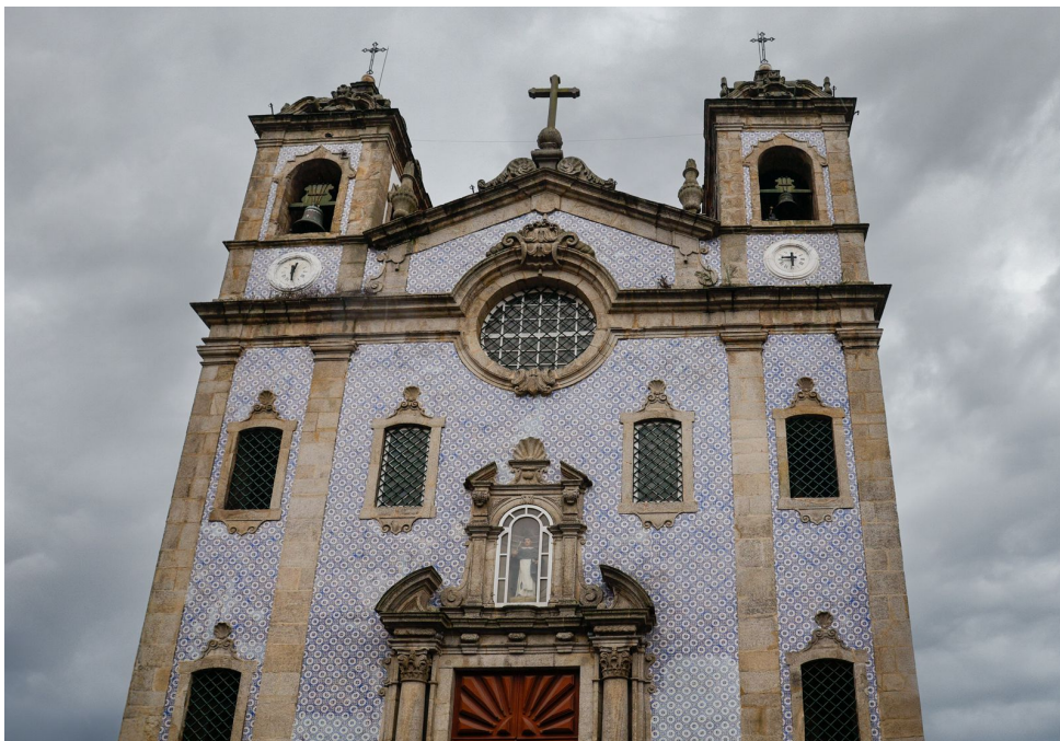
Igreja do Corpo Santo de Massarelos.

Ora, foi assim que em 1394 estes marinheiros, de modo a cumprirem a promessa se organizaram em Confraria – A Confraria das Almas do Corpo Santo de Massarelos , a qual ainda hoje se mantém fiel aos seus objetivos e que é uma das mais antigas instituições da cidade do Porto.