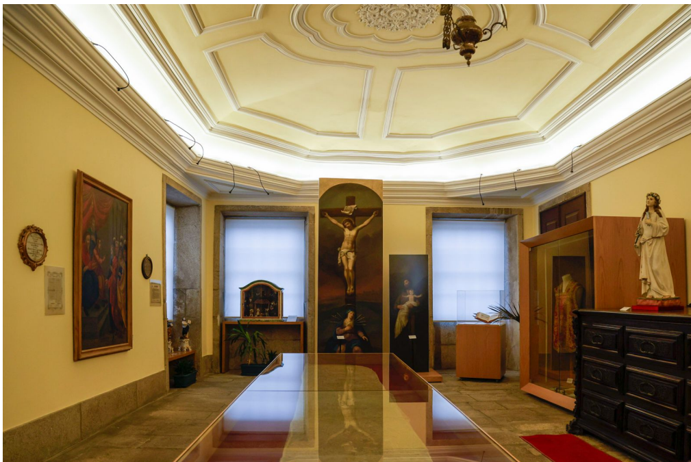
Núcleo Museológico da Confraria das Almas do Corpo Santo de Massarelos.

É neste pequeno museu que se encontra no interior da Igreja, no espaço em que outrora foi a Sacristia, que podem ser contempladas peças de arte sacra e de joalheria bem como, uma custódia em prata (Século XVI), o livro “A Arte de Navegar” (edição de 1746), o tríptico de telas (Século XVII) e o presépio da escola “Machado de Castro” (Século XVIII).