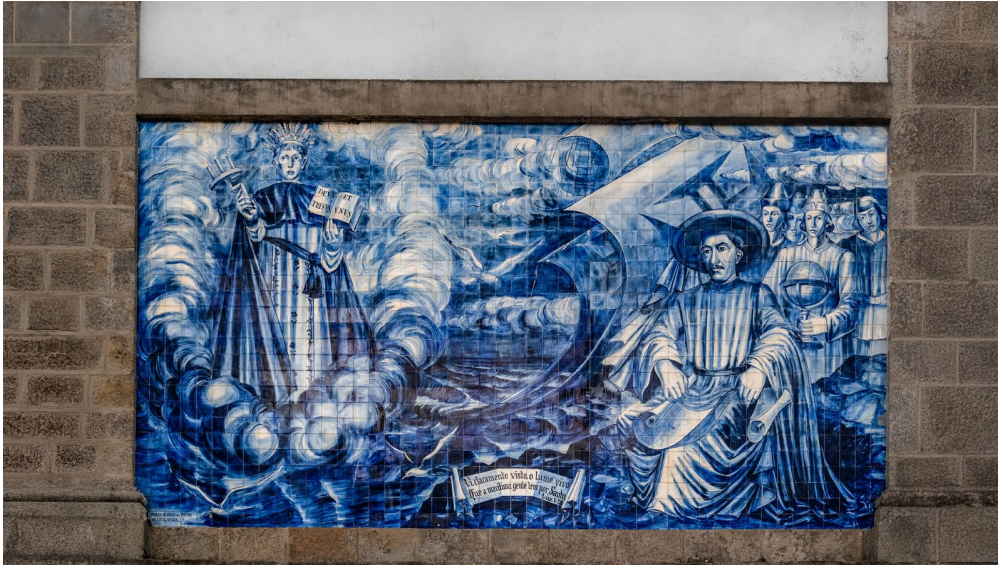
Painel de azulejos com a figura o Infante D. Henrique na Igreja do Corpo Santo de Massarelos.