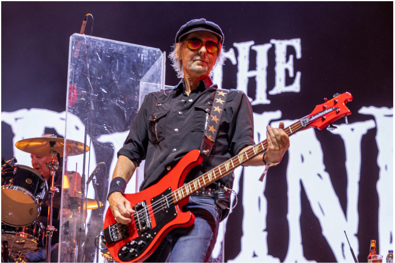
THE DAMNED (Paul Gray)