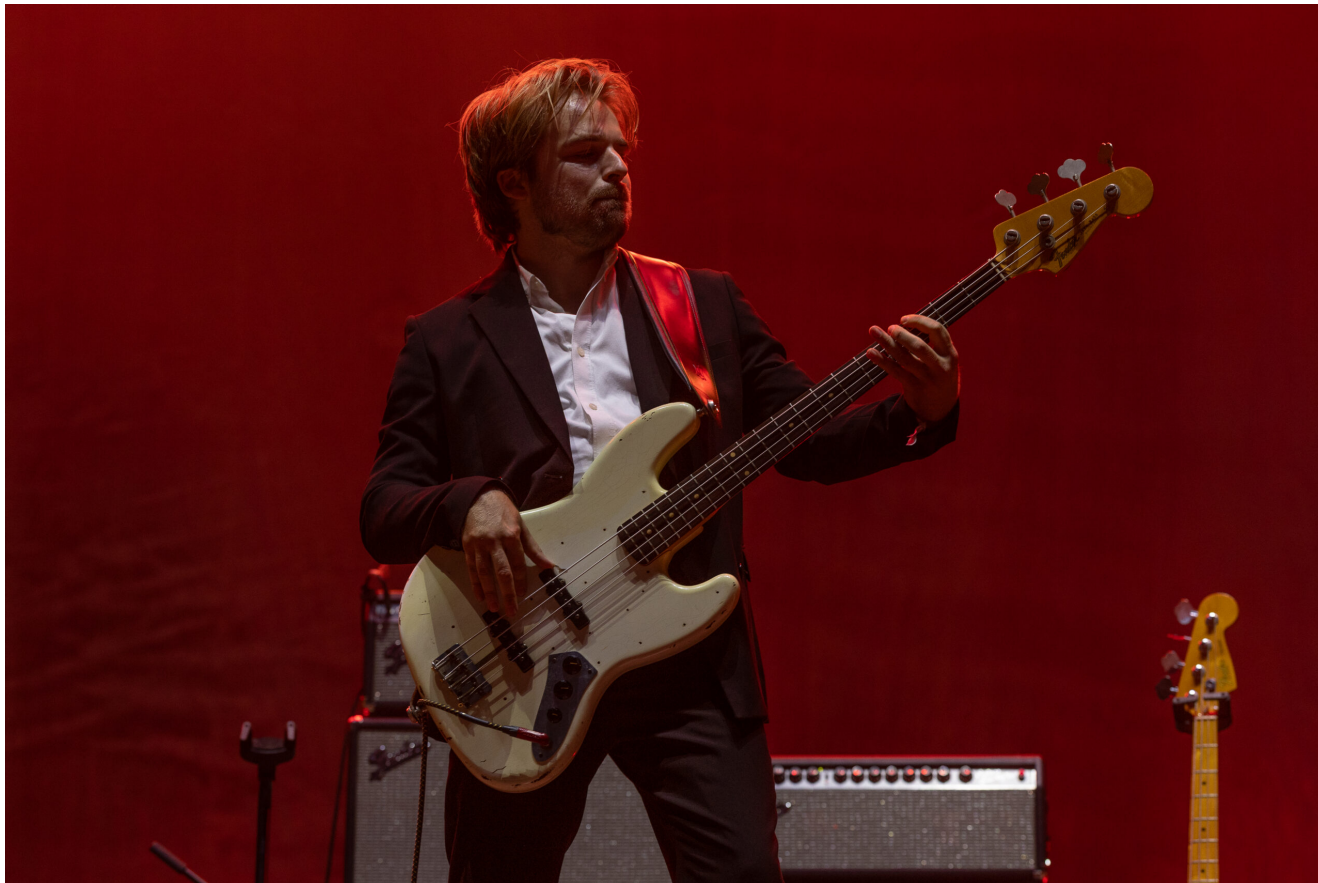
TRIGGERFINGER (Ruben Block) - Foto: ANTÓNIO PROENÇA | 0 Cidadão