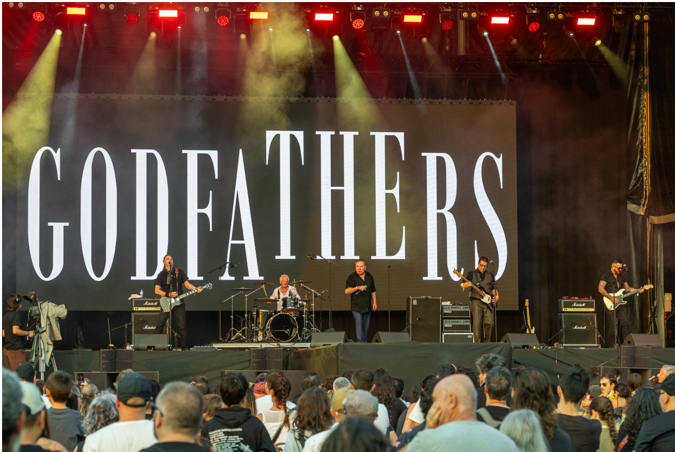
THE GODFATHERS