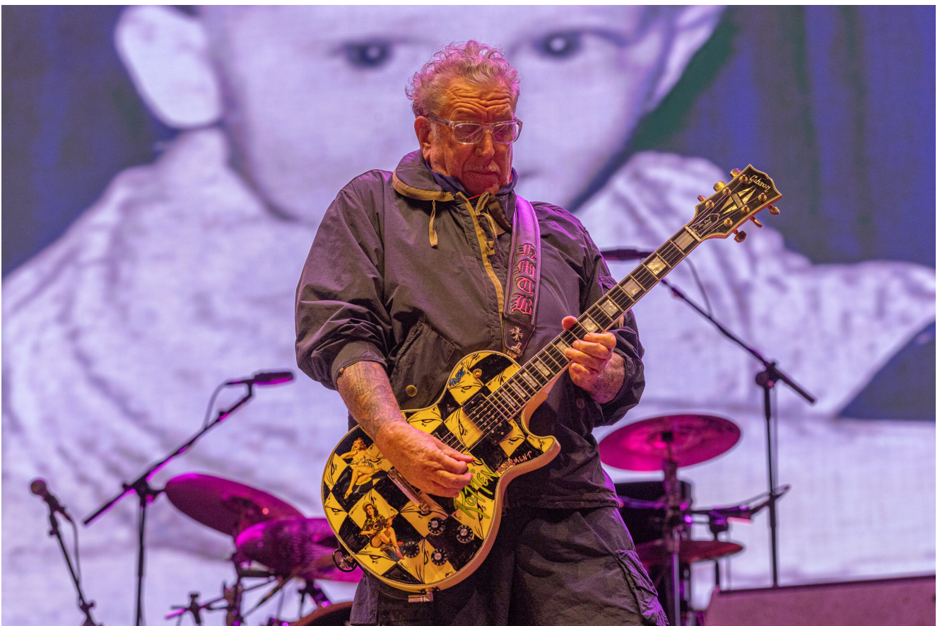
SEX PISTOLS (Steve Jones)