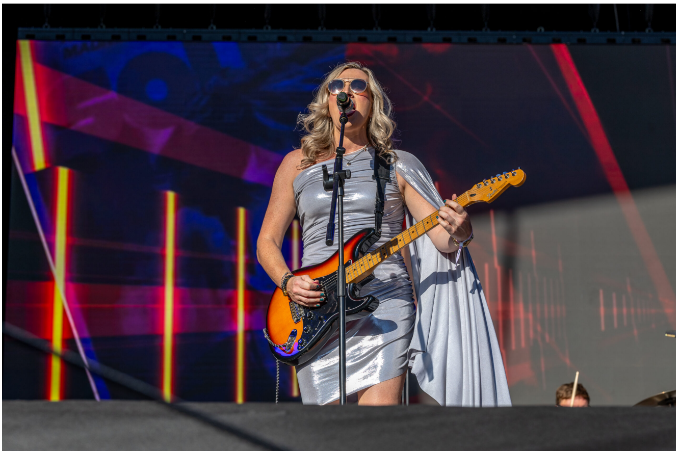
ALTERED IMAGES