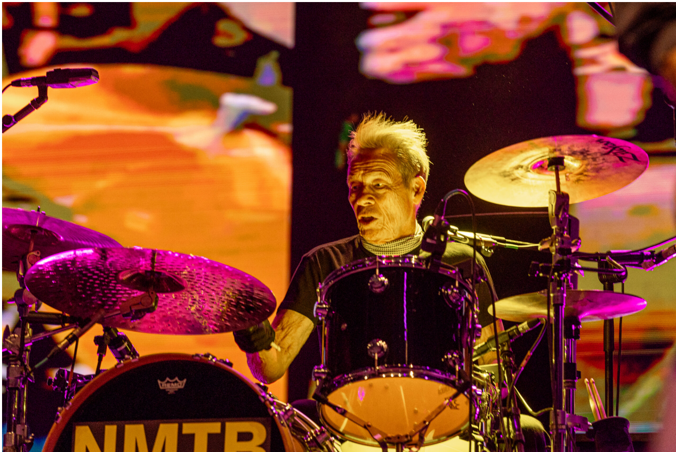
SEX PISTOLS (Paulo Cook)