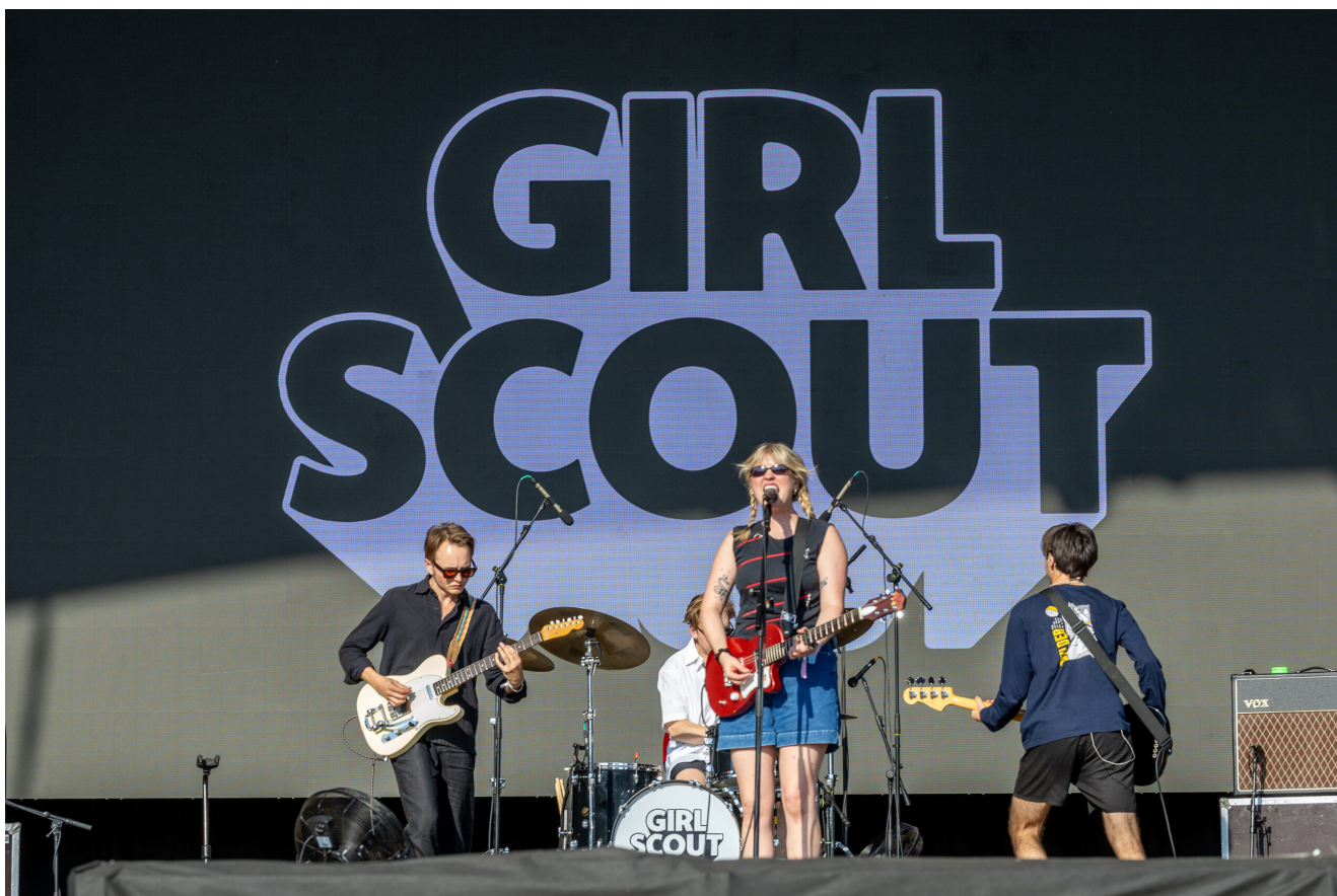
GIRL SCOUT

No encerramento, a 23 de agosto, o cartaz proporcionou uma