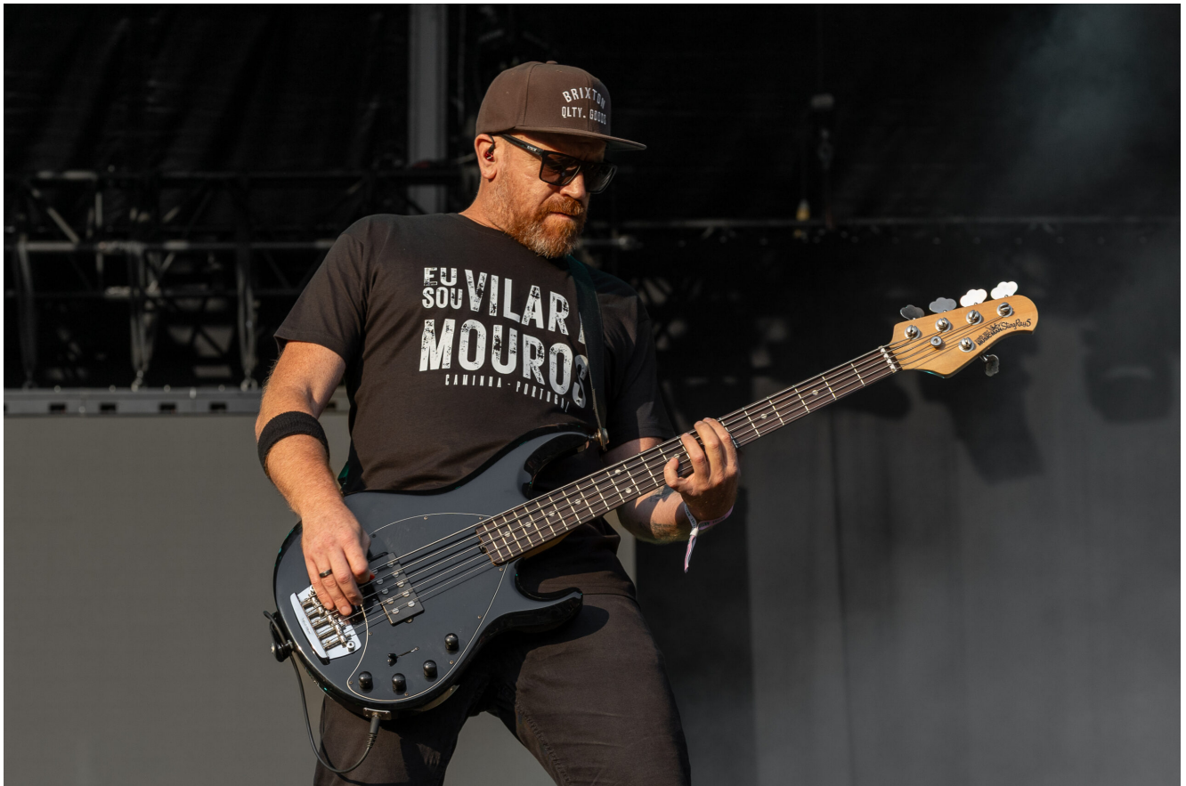
HYBRID THEORY (Nuno Bernardo)