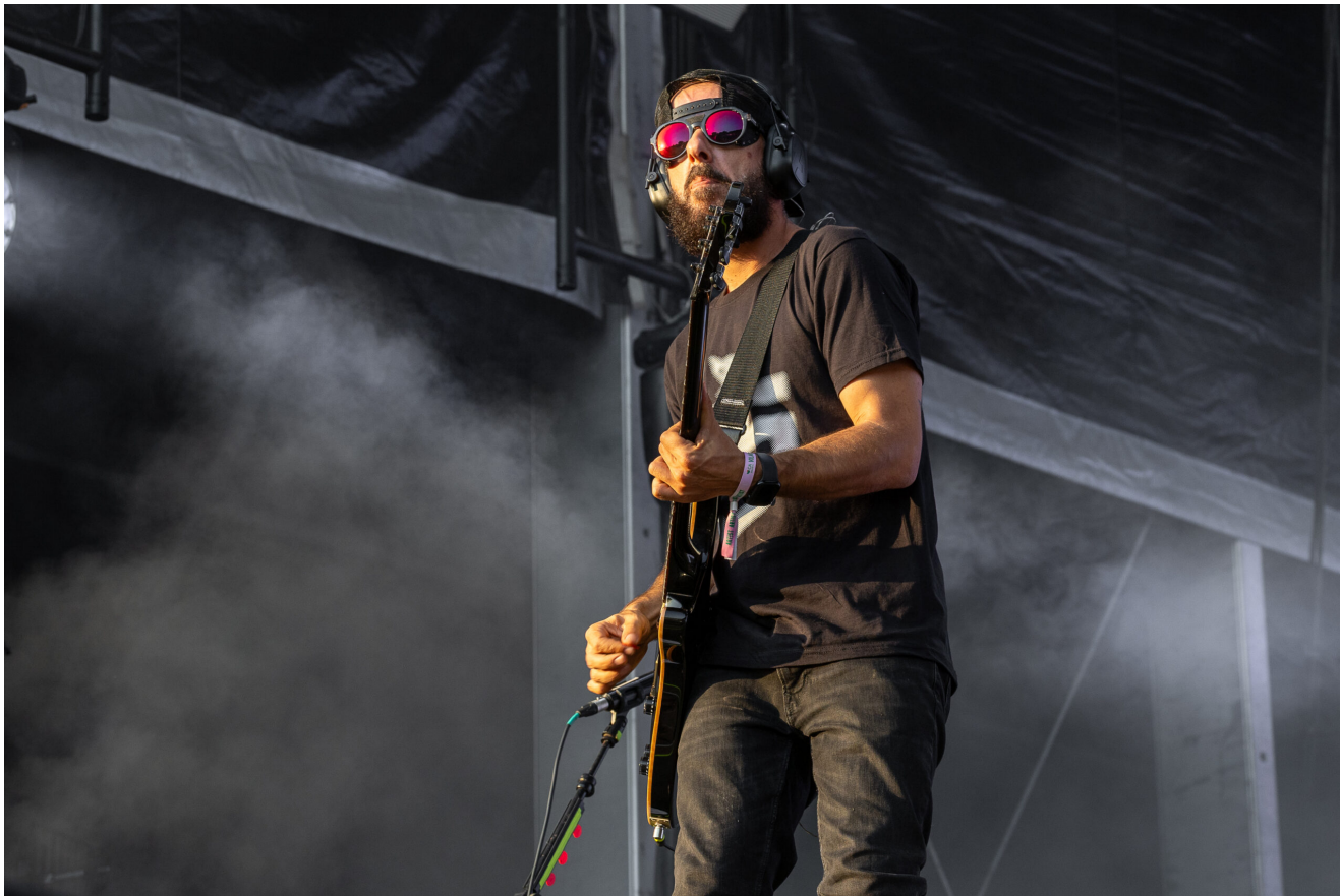
HYBRID THEORY (Miguel Martins) - Foto: ANTÓNIO PROENÇA | O Cidadão