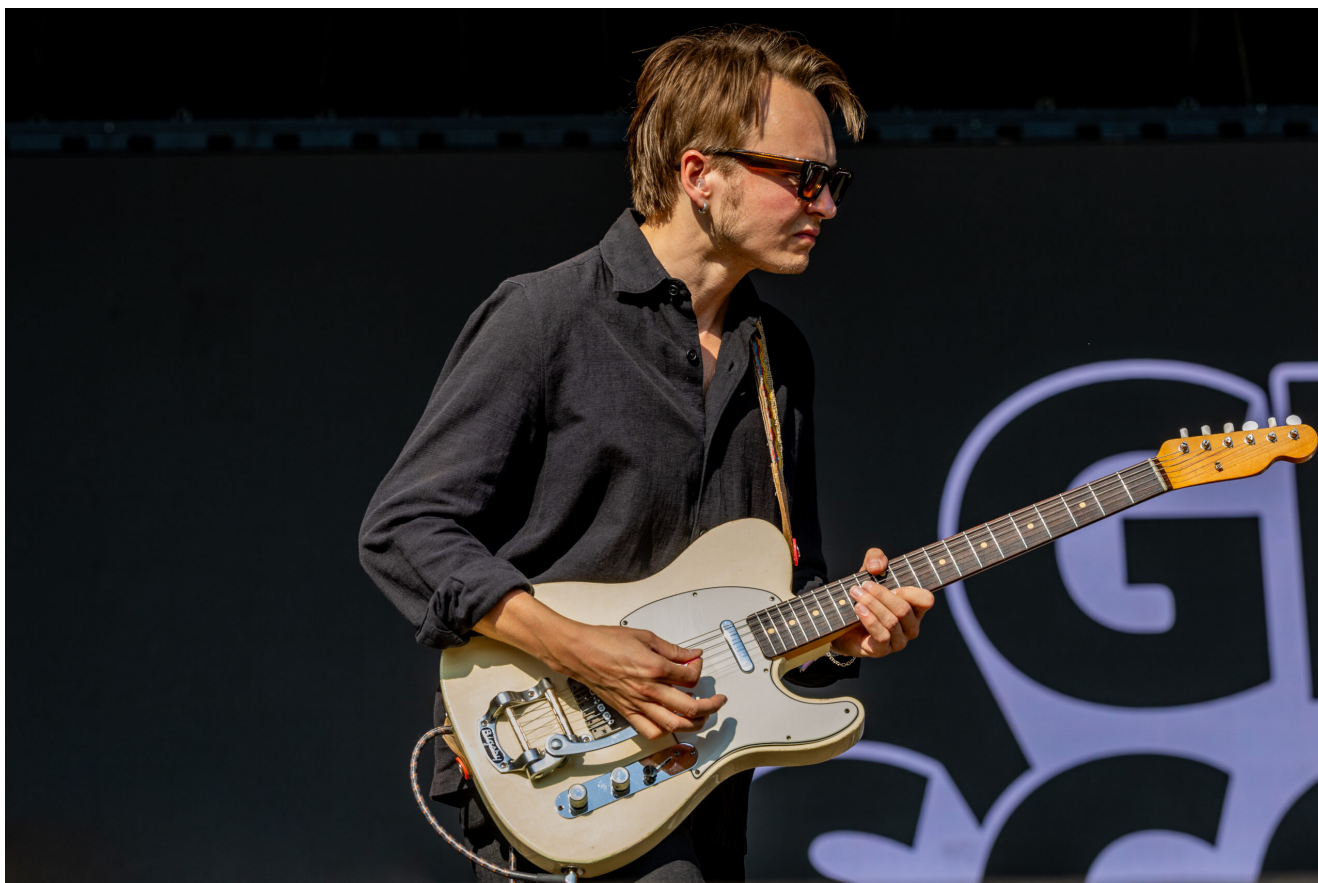
GIRL SCOUT