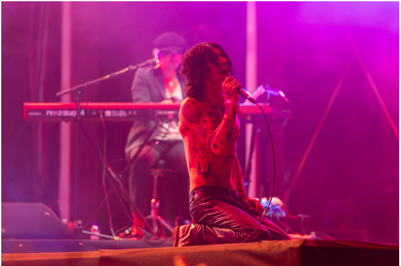
PALAYE ROYALE (Remington Leith)