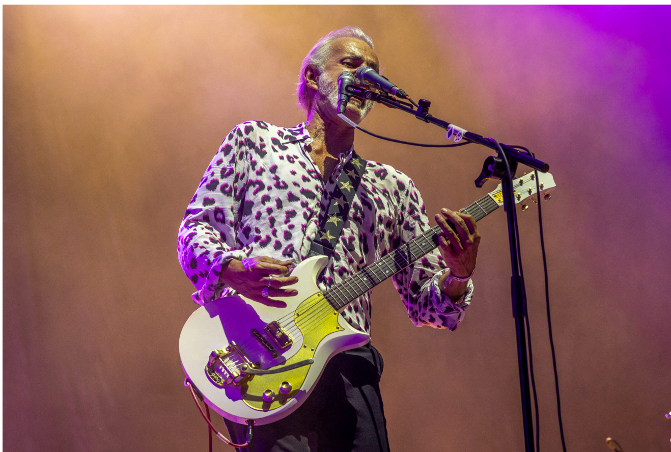
TRIGGERFINGER (Ruben Block)