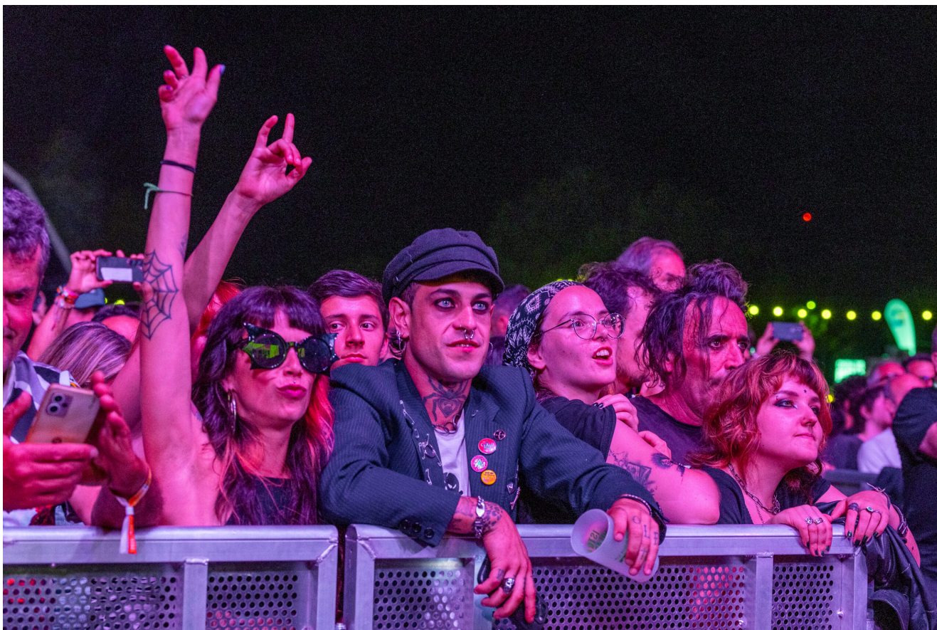
SEX PISTOLS