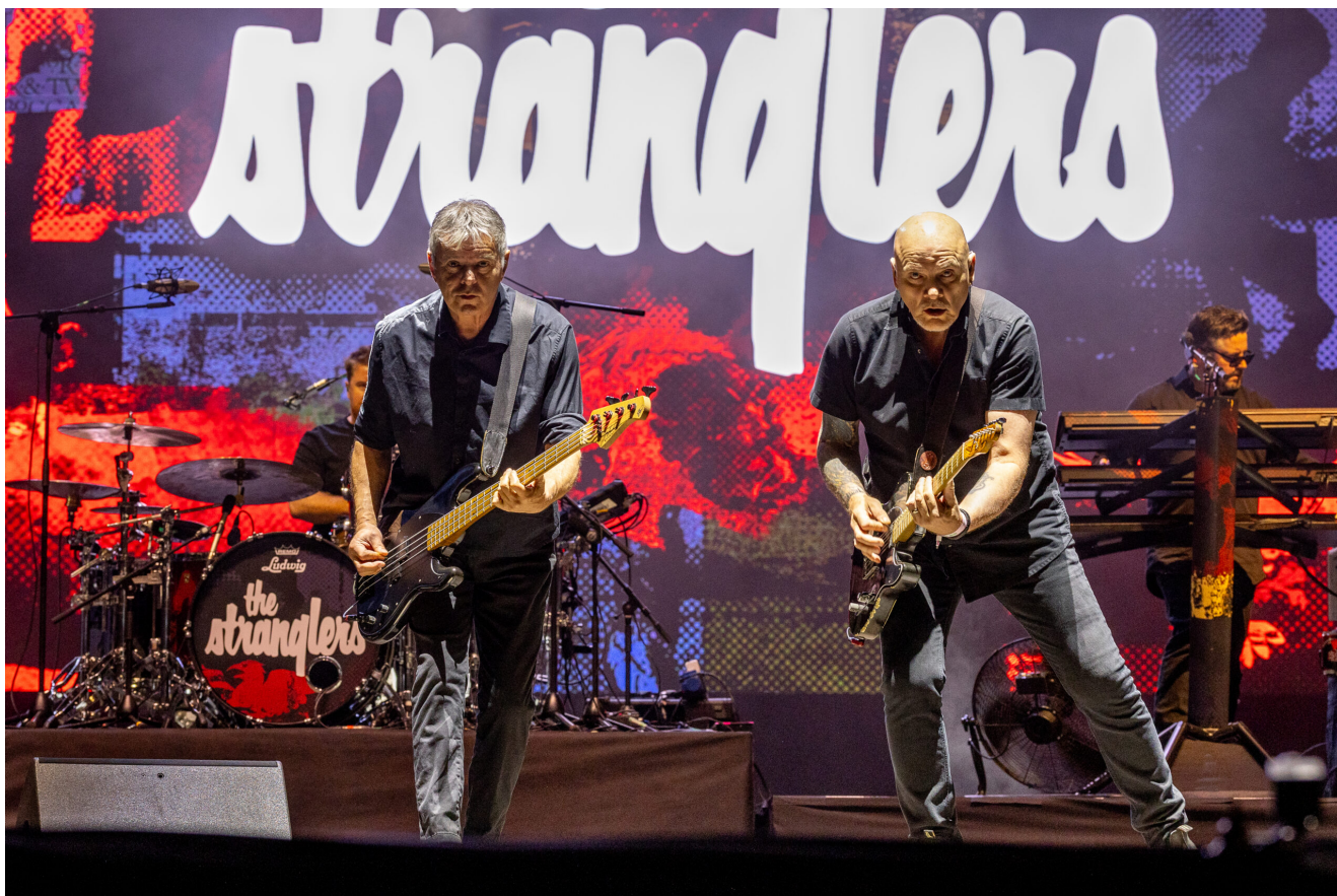
THE STRANGLERS (Jean-Jacques Burnel e Baz Warne)