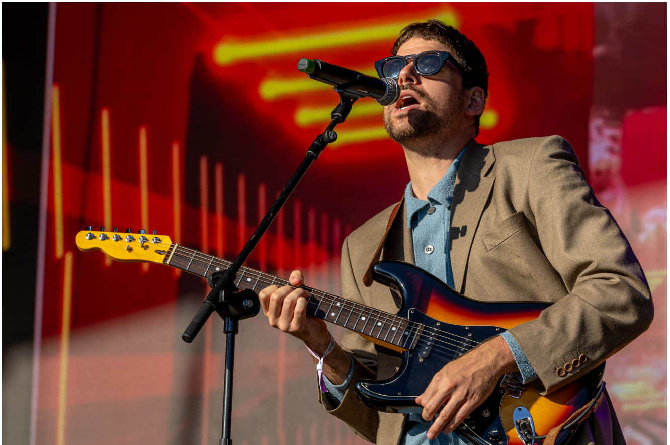
ALTERED IMAGES - Foto: ANTÓNIO PROENÇA | O Cidadão