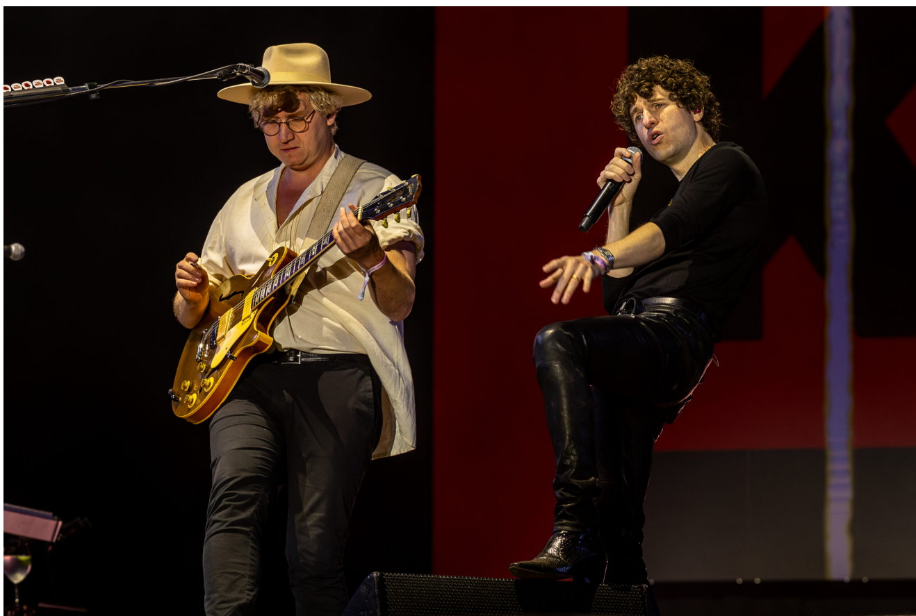
THE KOOKS (Hugh Harris e Luke Pritchard)