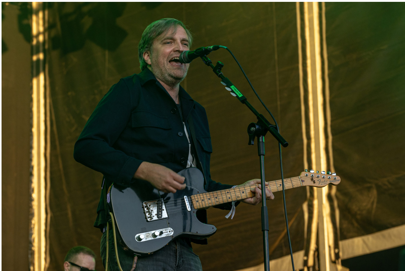
STARSAILOR (James Walsh)