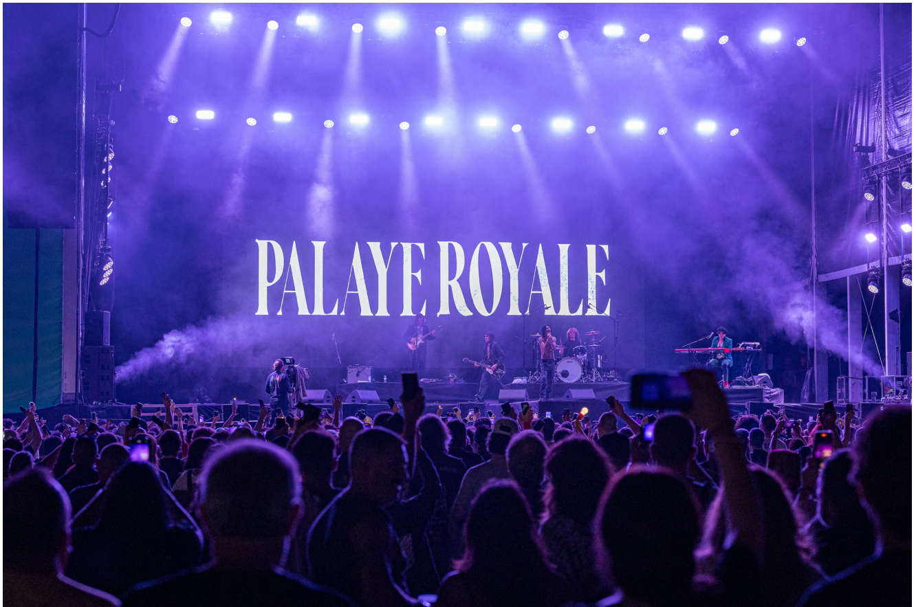
PALAYE ROYALE