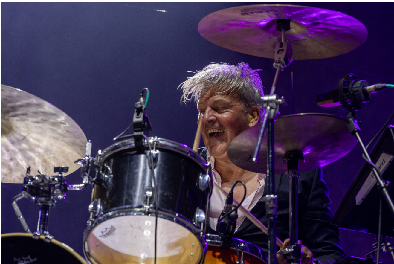
TRIGGERFINGER (Mario Goossens) - Foto: ANTÓNIO PROENÇA | 0 Cidadão