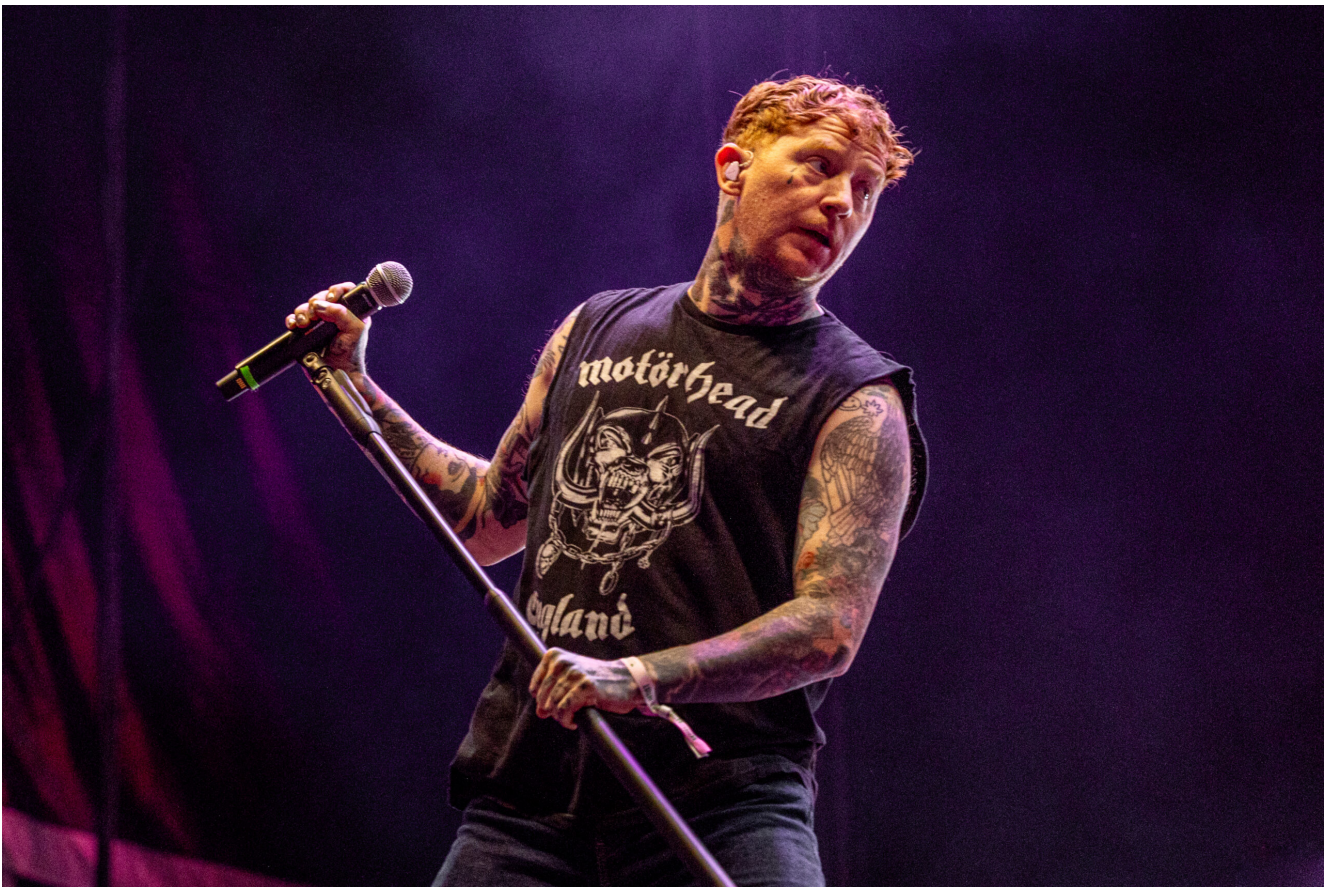
SEX PISTOLS (Frank Carter)