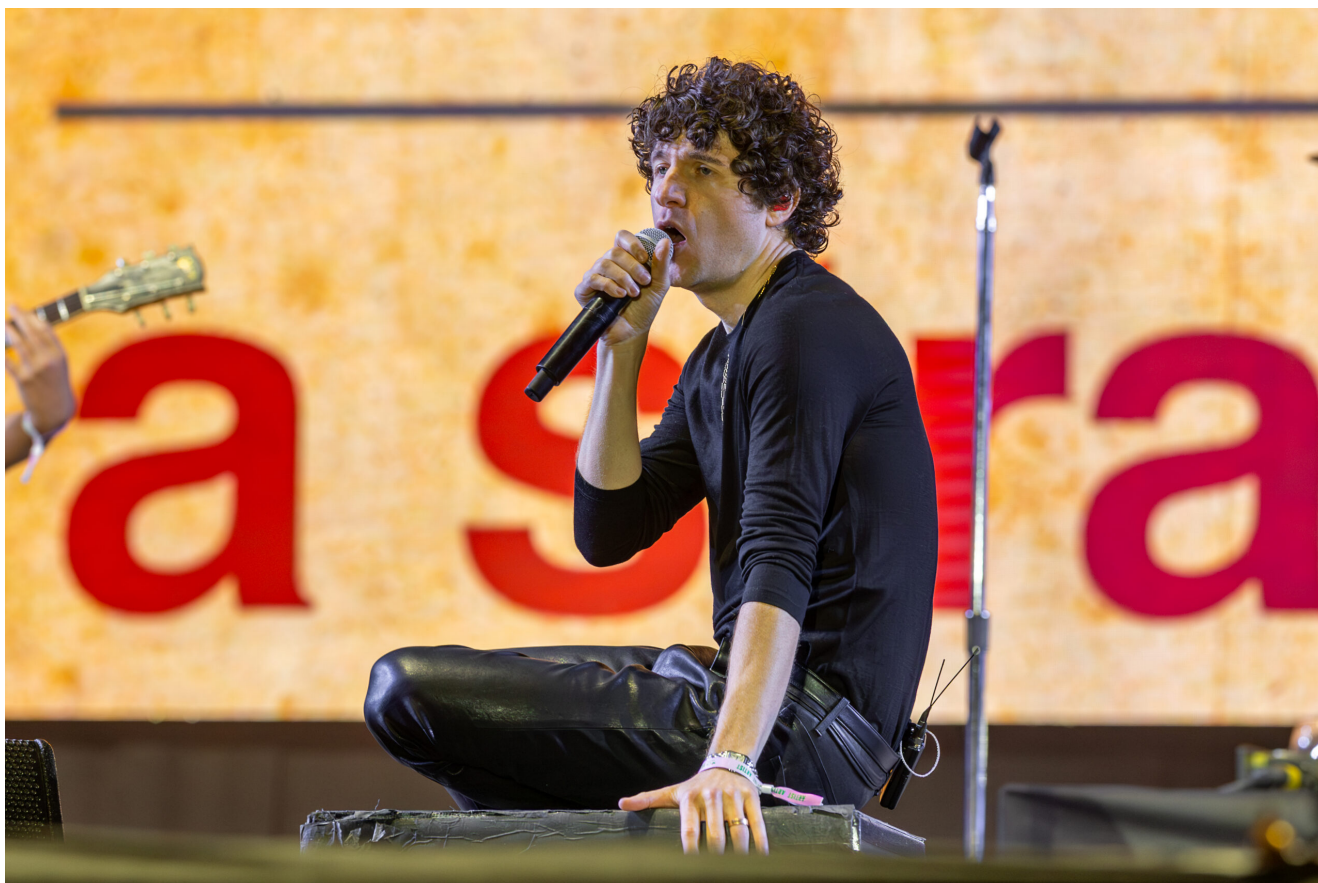
THE KOOKS (Luke Pritchard)