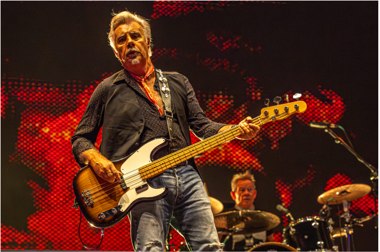
SEX PISTOLS (Glen Matlock)